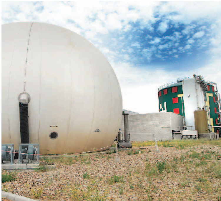
LA PLANTA DE BIOMETANIZACIÓN y Compostaje de Pinto produce 117.000 MWh al año

Resultado de una política de extinción de incendios moderna y decidida, pero también de las campañas de información, de la colaboración ciudadana, de la profesionalidad de los medios humanos y de la eficacia de los medios técnicos, en 2006 se ha